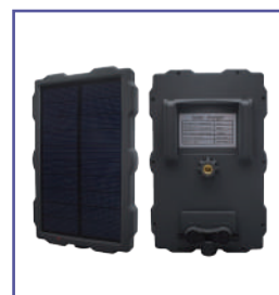
AT0002 戶外用太陽能板電池 (延長縮時拍攝時間)