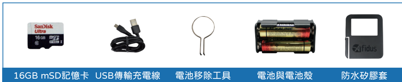
16GB mSD記憶卡 USB傳輸充電線 電池移除工具 電池與電池殼 防水矽膠套