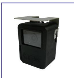
AT0001/B 戶外用金屬遮光罩 (304不鏽鋼)